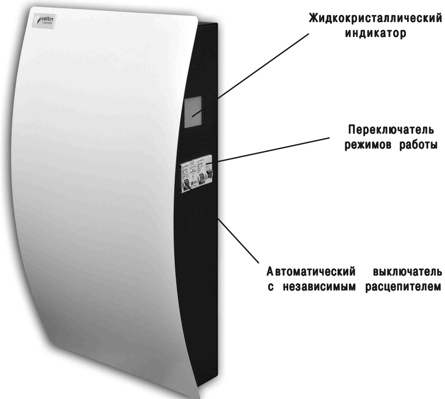
Рис. 1. Стабилизатор напряжения

В верхней части расположен клеммник, для подключения стабилизатора, закрытый крышкой. Там же расположен заземляющий контакт.