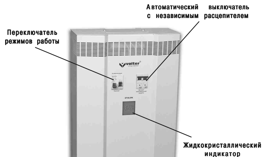
Рис. 1. Стабилизатор напряжения

В верхней части расположен клеммник, для подключения стабилизатора, закрытый крышкой. Там же расположен заземляющий контакт.