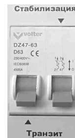
Рис.7. Отключены оба режима.

1. Выключите автоматический выключатель на лицевой панели стабилизатора (вниз).