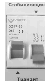
Рис.7 Режим «Транзит».

1. Выключите автоматический выключатель на боковой панели стабилизатора (вниз).