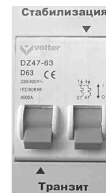
Рис.6 Отключены оба режима.